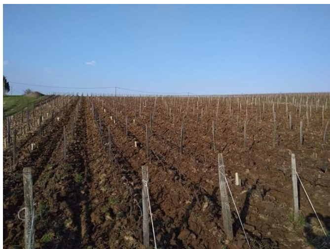
buttage de la parcelle de gamay.

Vincent veut acheter 1 enjambeur équipé d'un pulvérisateur : Il en a déjà un mais un 2ème lui permettrait pendant la grosse période de travail et traitements à la vigne, d'équiper différemment les 2 enjambeurs, l'un pour le travail des sols et de la végétation, l'autre pour les pulvérisations, économisant ainsi beaucoup de temps et d'énergie. Car Vincent travaille seul, il n'a pas de salarié en dehors des vendanges. Sur un enjambeur, c'est beaucoup plus compliqué que sur un tracteur de changer de matériel, et en été il faut travailler le sol, mettre la rogneuse (pour couper la végétation qui se développe très vite) et traiter. En bio, il faut être très réactif pour mettre du Cuivre au bon moment.